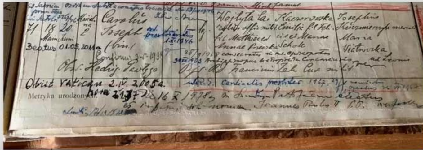
Księga chrztów par. Wodowice

W genealogię osoby wpisana jest genealogia rodziny. Upamiętnią to zapisy w księgach parafialnych , w księdze chrztów , ale akt ten jest już tylko pochodną, jest społeczną konsekwencją faktu, „że się człowiek narodził na świat” (J 16,21). [Jan Paweł II - List do rodzin „Gratissimam sane”]